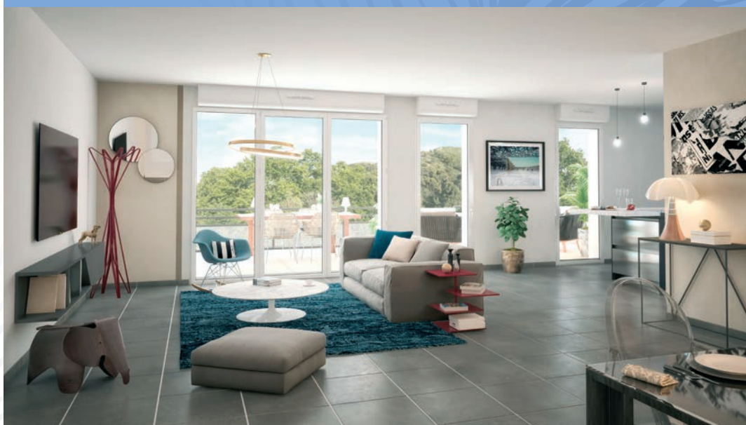
Exemple : appartement 4 pièces - bâtiment B