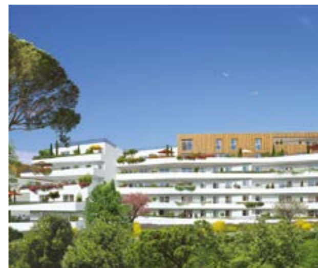
MARSEILLE 8 ème O'PARK