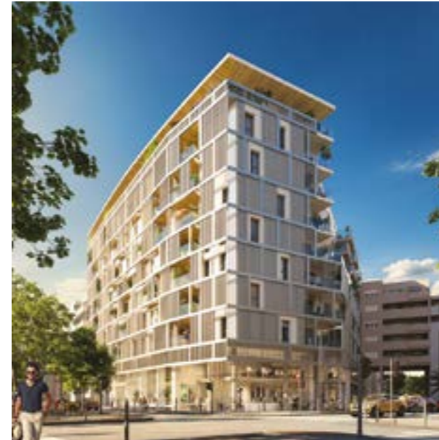
MARSEILLE 6 ème INITIAL PRADO