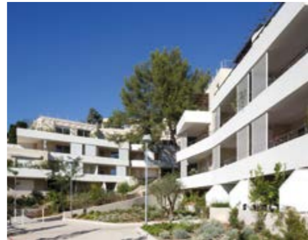
HYÈRES LE KASTEL

Aujourd'hui, l'agence s'engage plus largement encore dans le renouveau de la métropole Aix-Marseille Provence en participant à des projets de grande ampleur comme l'extension de l'aéroport Marseille Provence, la transformation de la rocade du Jarret en boulevard urbain multimodal, la requalification du Cours Lieutaud.