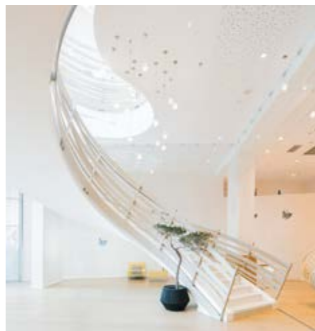
AIX-EN-PROVENCE HÔTEL RENAISSANCE 5* MARRIOTT