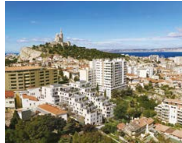
MARSEILLE 6 ème ALTITUDE VAUBAN