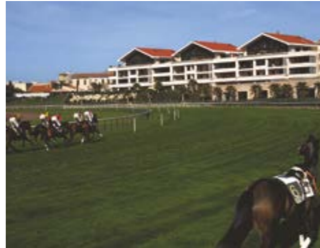
MARSEILLE 8 ème CHATEAU BORÉLY