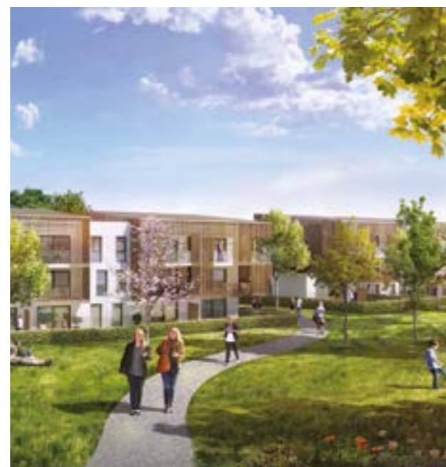
BOUC-BEL-AIR BEL OMBRE