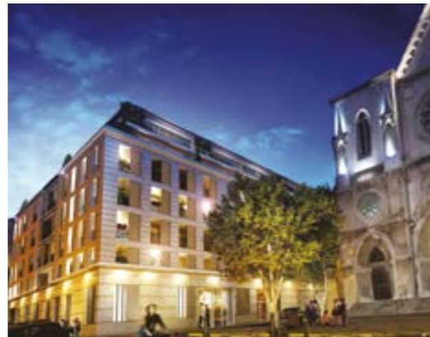
MARSEILLE 5 ème L'ARCHANGE