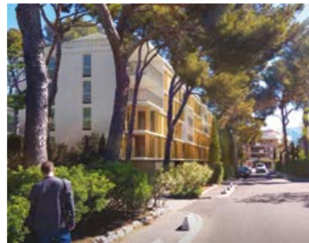
MARSEILLE 9 ème LES PINS D'ISABELLA